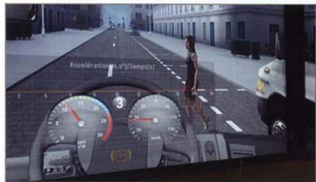
La ressemblance avec les « Sims » est frappante. Eh oui, ce piéton était caché derrière l'utilitaire à droite.