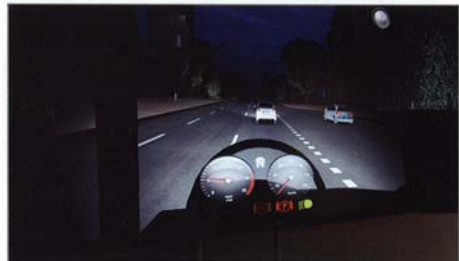
La simulation lors de la conduite de nuit est particulièrement bien réalisée. On peut changer la météo en plus !